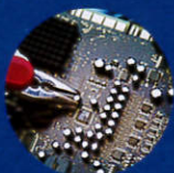
半导体芯片 清洗废水